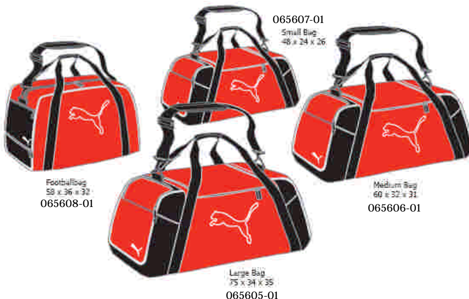
065607-01 Small Bag 48 x 24 x 26