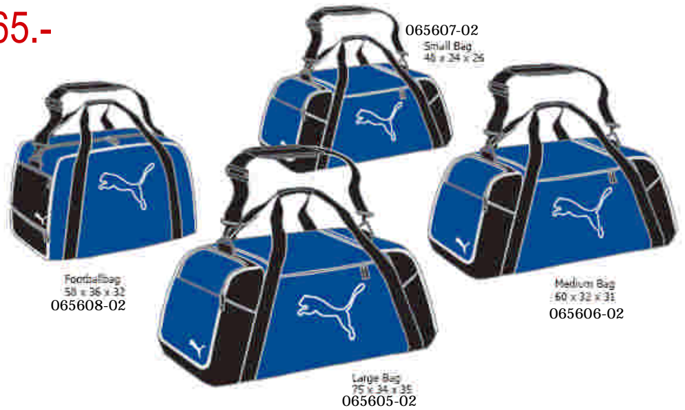
065607-02 Small Bag 48 x 24 x 26