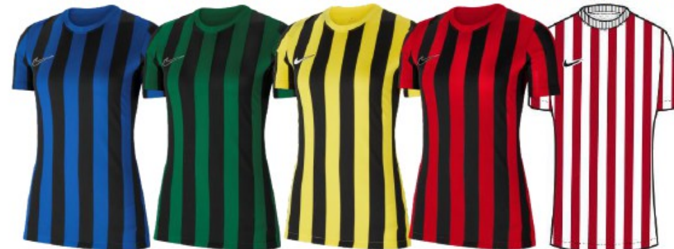
FARB-NR.: 463 302 719 658 104