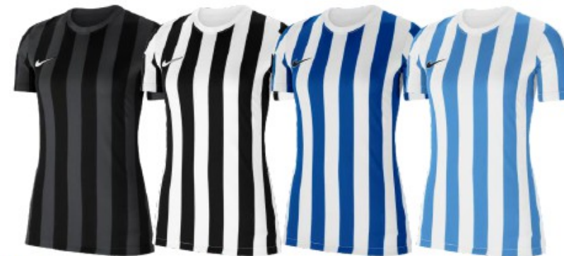
FARB-NR.: 060 100 102 103