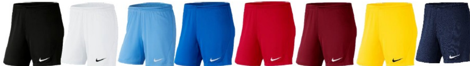
FARB-NR.: 010 100 412 463 657 677 719 410